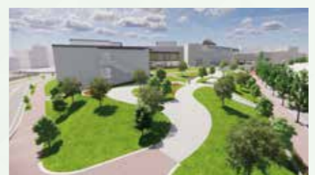
▲イベント広場(同施設の隣接地)