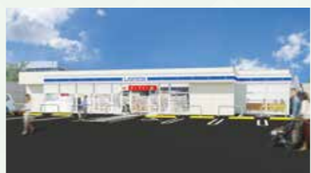
▲コンビニ(スポーツセンター出入口付近)