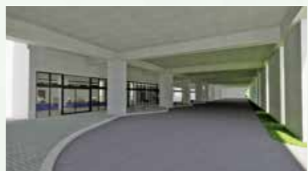
▲コミュニティバスセンター(同施設1階)