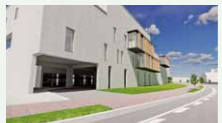
▲同施設の外観(東側)

問い合わせ先 経営企画課企画担当 ☎(584) 1133 ☎(584) 1145