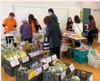
▲平田台地区移動販売会 (ひまわりストア)

民生委員になって以来、なるべく多くの人とおしゃべりをすることを心掛けるようになりました。担当地区の戸別訪問などで、直接会った時や電話で、「気軽にしてくれてありがとう」という言葉を掛けてもらうと、うれしくて思わず笑顔になります。困ったことがあれば、「気軽に相談してほしくね。」地域では、サロンの他に、買い物に困る人のための移動販売会にも携わっています。立ち上げ当初から関わっているのが、多くの人に喜んでもらえることが活動の励みになっています。