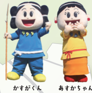
かすがくん あすかちゃん