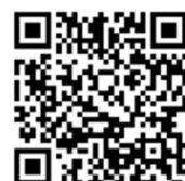
共栄資源管理センター