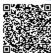
コンポスト用具購入費補助