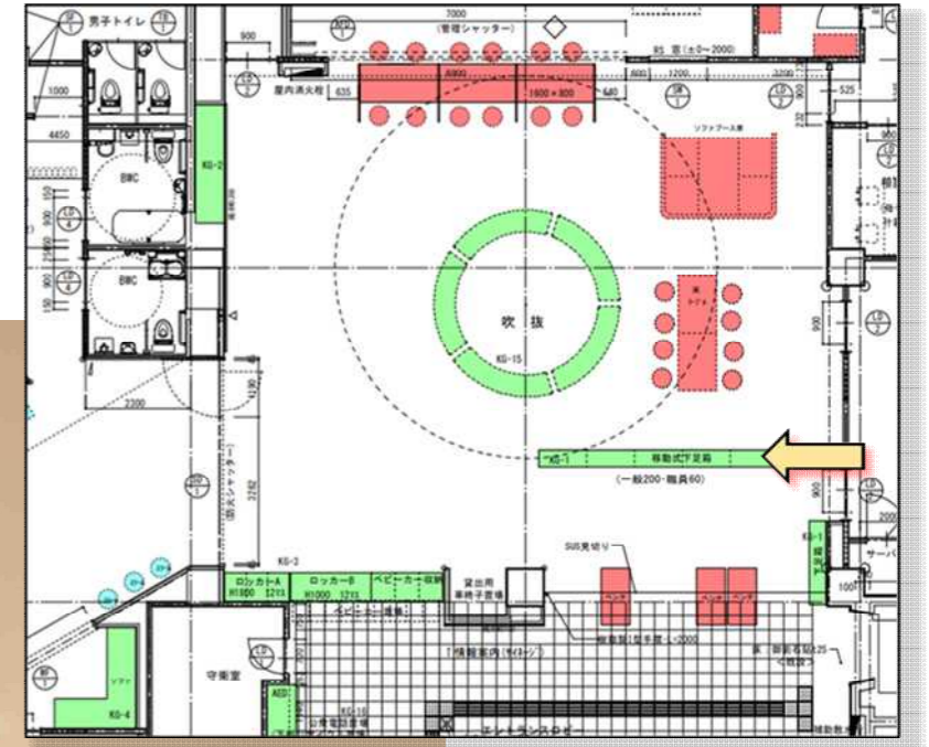
イメージパース視点