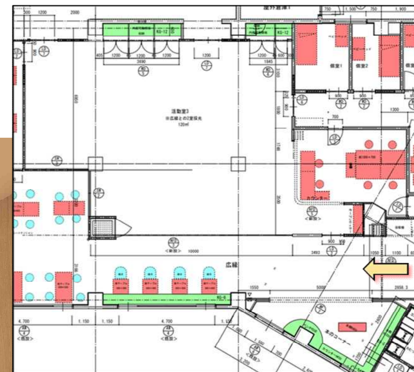
イメージパース視点