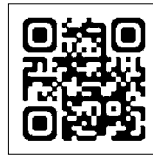
▲母子手帳アプリ「母子モ」