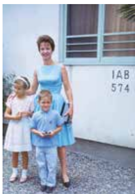
▲米軍ハウスと将校の家族