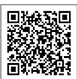
▲デコ活サイト (環境省)

問い合わせ先 環境課環境推進担当 ☎(584)1111(代) F(584)1147