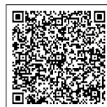
▲個別接種実施医療機関

※3月31日以降は、アプリのインストールも停止します。現在の接種証明書が必要な場合、アプリ上の機能「この証明書を画像として保存」により、期間内に保存してください。なお、健康課窓口では引き続き、令和5年度以前の接種記録分の証明書発行を行います。