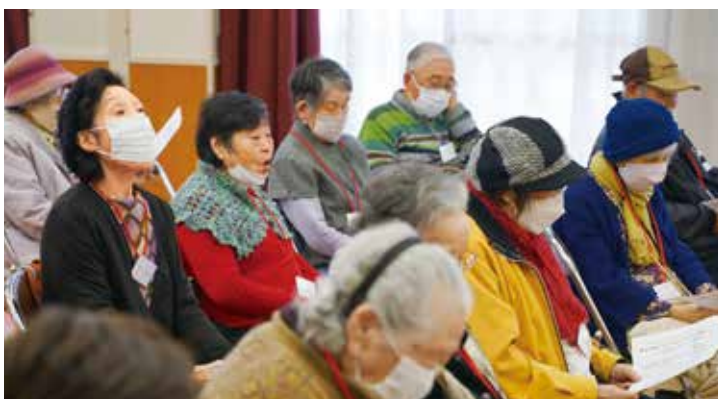
▲桜ヶ丘地区いきいきサロン