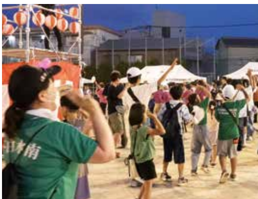
▲下白水南地区夏まつり

地域の自主防災組織では、定期的な防災訓練を行い、地域の「万が一」に備えています。