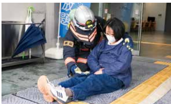
▲要救助者の救出活動訓練

1月31日、奴国の丘歴史資料館で、春日・大野城・那珂川消防組合消防本部と市文化財課が合同で消防訓練を実施しました。