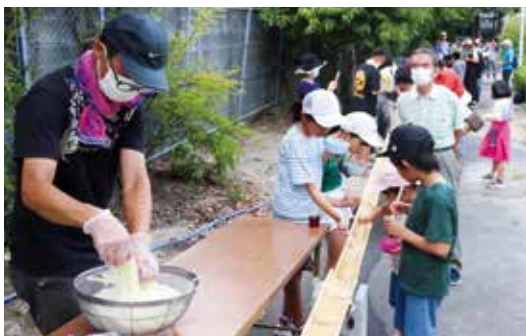
▲多くの参加者でにぎわう流しそうめん

今後も、現役世代が地域に主体的に関わっていくために、青もみじがその入口となるよう取り組んでいきたいと思えます。