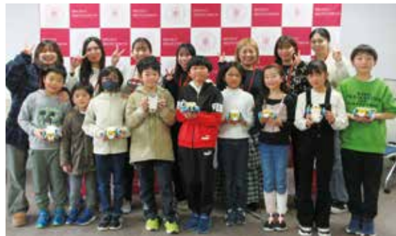
▲講師をした学生と参加した子どもたち

1月27日、福岡女学院大学でデジタルワークショップが開催され、市内の小学4年生17人が参加しました。