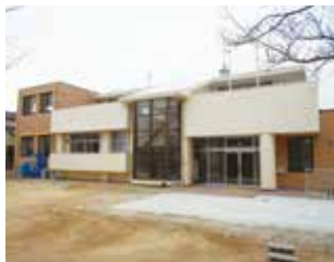
▲弥生コミュニティ供用施設

弥生コミュニティ供用施設の大規模改修工事が完了し、一時移転していた自治会事務所が元の場所に戻りました。 所在地 弥生7-50 問い合わせ先 弥生地区自治会 ☎(582)8412(兼用)