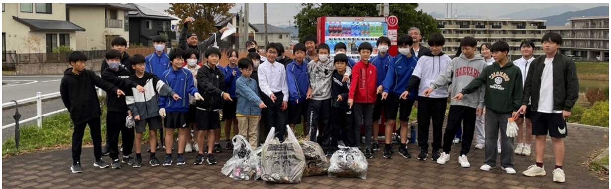
【松ヶ丘地区の清掃に取り組んだ生徒達】