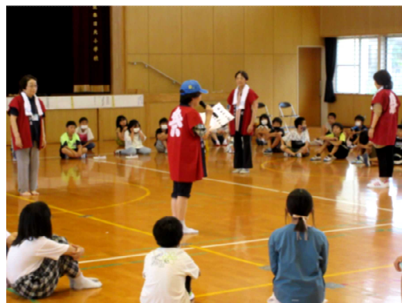
【春日北小 みんなでおどろう】