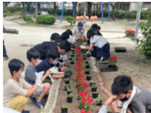
【桜ヶ丘地区での活動】