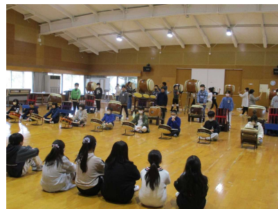
【4年生に惣利太鼓を披露する5年生】

私は、これからも惣利太鼓を受けついでいこうと思いました。本当にありがとうございました。