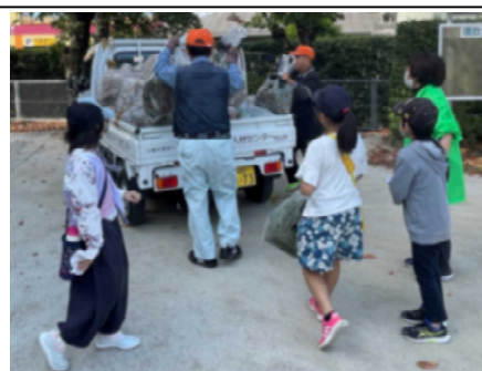
【地域の方とともに活動する姿】