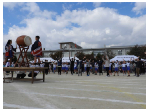
【運動会「全校表現」の様子】