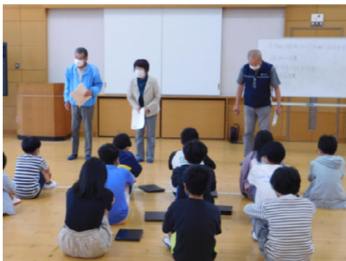
【事前打合せの様子】

ぼくは、地域クリーン活動でナギの杜をそうじしました。そうじをして思ったことは、2つあります。一つ目は、ごみがなくなるというのは難しいと思いました。理由は、午前中、中学生が来てそうじをしてくれたし、午後は、ぼくたちがそうじをしに行ったのに、ごみが全てなくならなかったからです。だから、ごみをなくすには、一人ひとりがごみを落とさないように意識したり、ごみを拾う習慣を作ろうと思いました。二つ目は、きれいになったら気持ち良いということです。終わった後、全部のごみは拾えなかったけれど、達成した感じがしてスッキリしました。だから、学校のそうじでも集中してそうじに取り組もうと思いました。