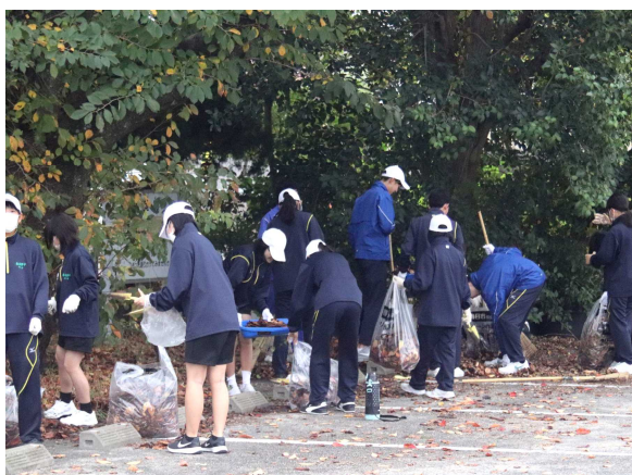
【春日野中 クリーン作戦】