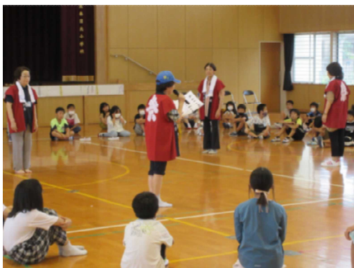
【須玖北自治会の皆様との学習】

春日北小学校は、ぼくたちが生まれる前にできたということを初めて知りました。わかい町春日ふるさと音頭の振り付けはむずかしくて、前に行ったり後に行ったりして、何がなんだか分からなくなってしまったところもあるけど、うまく踊ることができたのでうれしかったです。またいつか、地域の人といっしょに踊りたいです。