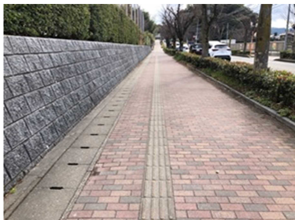
▲【本校周辺の通学路】

私は今回の掃除で、「ゴミの量の凄さ」と「植物が剪定されていたこと」に気づいた。たくさんの人が通る通学路を、これからも気づいたときにはゴミ拾いをして、綺麗にしていこうと思う。私一人ではなかなか通学路などの街が綺麗にならないので、これからはたくさんの人が街をもっと綺麗にしていってほしいと考える。少しでも綺麗な環境にして、通学路を通じて心が温まる人が増えたらいいなと考えている。みんなの暮らす街のために。地域のために。