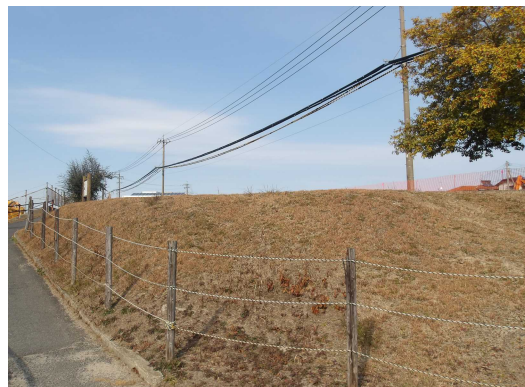
▲市指定遺跡「原遺跡」