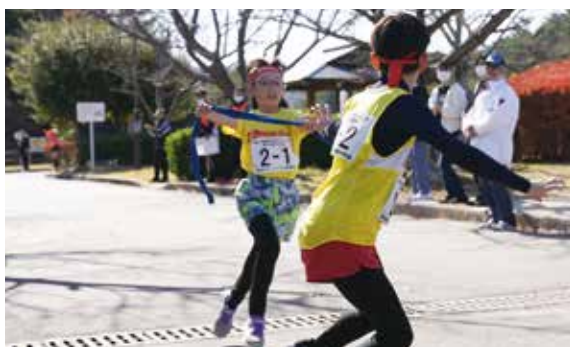
▲駅伝でたすきをつなぐ参加者

11月26日、白水大池公園で走ろう大会が開催され、未就学児から大人まで220人が参加しました。