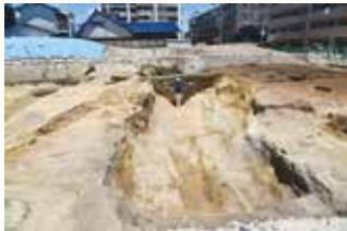
▲発掘調査で見つかった堀

遺跡の理解には、発掘調査以外に、文献史料、古い地名聞き取りなどの複合的な調査も大切です。 5〜8月に発掘した古水遺跡(下白水北)では、幅約4.7m、深さ約2.5mの溝が見つかり、天浦城の堀と分かりました。 天浦城は、戦国時代の終わりにあつた筑紫氏の城で、白水ノ城とも呼ばれます。筑紫氏は鳥栖市を本拠地に肥前肥後、筑前の一部を支配した戦国大名です。この城は福岡