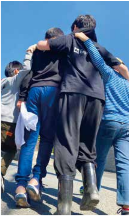
▲肩を組んで外出先から帰る子どもたち