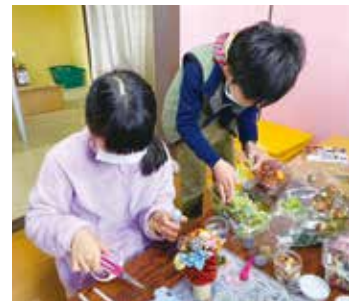
▲フラワーアレンジメントなどの体験も

けても「できない、やらない、帰る」が口癖でした。徐々に通う時間は伸びていきました。が、何か取り組むときはお母さんの手助けが必要でした。少しずつ力を蓄えることさえできれば、自分でやり切れるようになる。そう信じて関わりました。そんな子が立派に司会進行をしている姿を見た時は、思わず涙が流れるほどうれしかったですね。