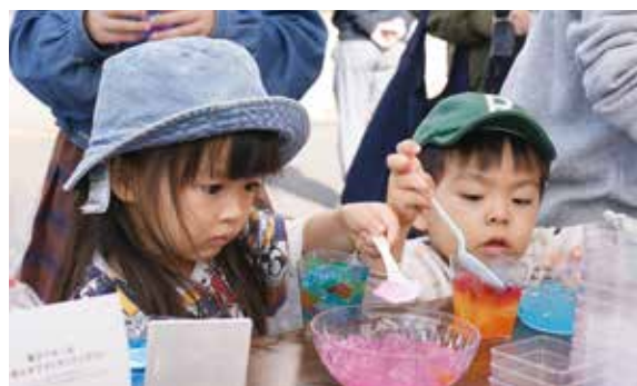
▲環境に優しいせっけん作りをする参加者

11月19日、市役所で「50年後の環境のことを考えよう」をテーマに、環境フェアを開催しました。動物愛護やごみ減量について考えるコーナーの他、太陽光パネルや電気自動車なども展示。毎年恒例のBOOK/ボタンやこども服配布会も多くの人でにぎわいました。ワークショップやゲームなどには親子連れが多数参加し、楽しみながら環境について学ぶ機会となりました。