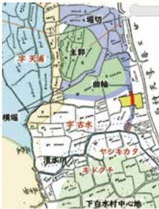
▲字図と城跡推定範囲 (黄色：調査地、赤色：堀)

このようにわずかな情報しかない中で、なぜ天浦城が特定できたのでしょうか。 一つは地図です。明治21年の古い地名が書かれた地図(以下、字図)と明治35年の地形図には、下白水村の北側に南北60m、東西40m、高さ6〜8m程度の小山(標高31m)があります。