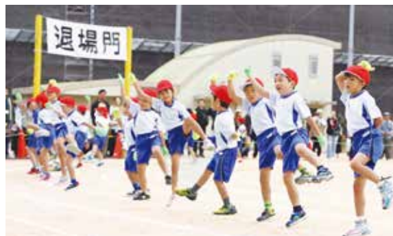
▲1年生みんなで元気にダンス