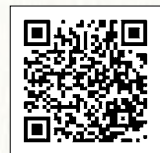
▲事務局ウェブサイト