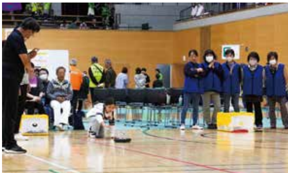
▲熱戦の中、緊張の一投

10月29日、総合スポーツセンター屋外競技場でグラウンド・ゴルフ大会、メインアリーナでカローリング大会が開催されました。これは、競技を通して運動に親しみ、人と人との交流の場づくりを目的として開催されたものです。