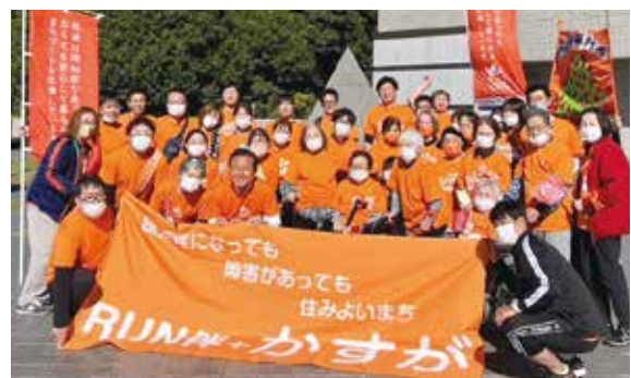
▲ゴールに集まった参加者の皆さん

10月21日、認知症になっても安心して暮らし続けることができるまちづくりに向けた街頭啓発イベントとして、RUN伴+が開催されました。