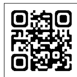
▲母子手帳アプリ「母子モ」