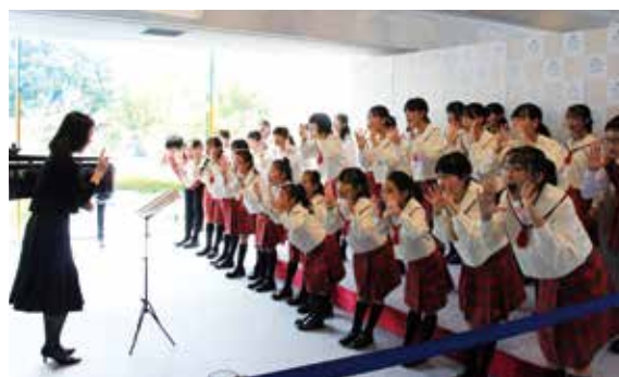
▲体いっぱい、歌の世界を表現する市少年少女合唱団

11月3、4日に、ふれあい文化センターで第50回春日市文化祭を開催しました。毎年恒例の作品展・芸能発表会・バザーなどに加え、ふれあいプラザでのミニステージを実施。市少年少女合唱団のミニコンサートや紙芝居、春日高等学校の箏曲部と書道部のパフォーマンスで会場を盛り上げました。なお、同校書道部の作品は令和6年1月31日(水)まで同センター新館に飾られます。