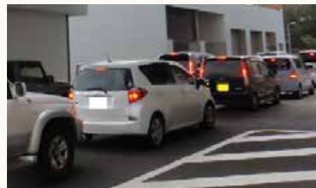
▲混雑するごみ処理施設