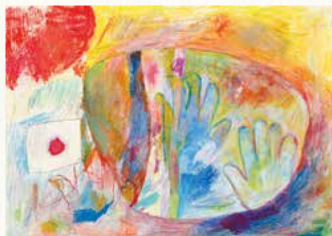
▲弥生の里大賞:「しあわせ」