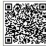
▲燃えるごみの予約 (自己搬入ごみ事前受付)