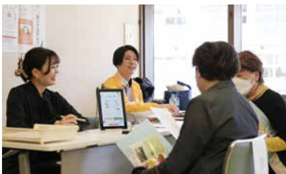
▲ベジチェック®で推定野菜摂取量を確認する来場者

10月22日、いきいきプラザ、春日小学校、福祉ぱれっと館を会場に「いきいきフェスタ春日2023」が開催されました。