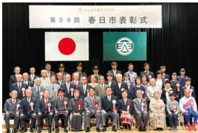
▲被表彰者の皆さんと市長