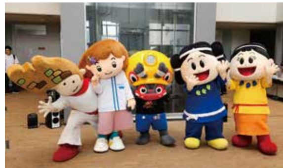
▲キャラクターステージショーの様子

5月27日、九州大学筑紫キャンパスでオープンキャンパスが開催されました。メインイベントの一つ「キャラクターステージショー」では、市のマスコットキャラクター「かすがくん」と「あすかちゃん」が登場し、会場に訪れた人は一緒に踊りを楽しみました。