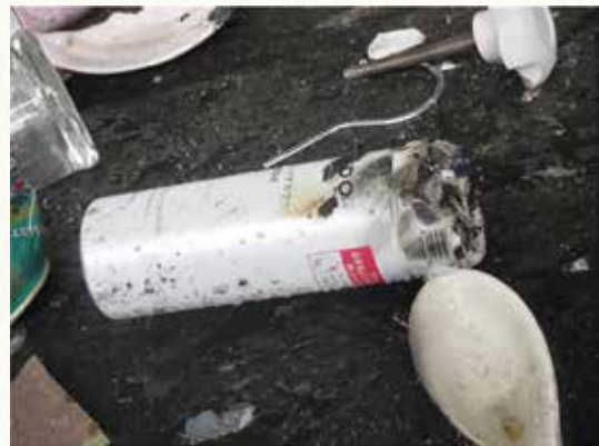
▲出火したスプレー缶

※スプレー缶やカセットボンベなどに穴を開けて処理をすると、引火して爆発の危険性がありますので、穴は開けないでください。