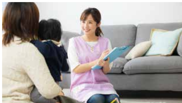
▲産後ケア事業(居宅訪問)のイメージ

妊 娠、出産、子育て期を通して、子どもの健やかな成長を実感できることは、家族や地域にとって喜ばしいことです。一方で、核家族化の進行などから子育て世帯が孤立化するリスクも高まっています。