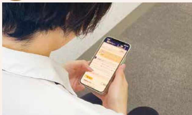
▲読み放題サービス利用のイメージ

春日市電子図書館で雑誌を読むことができるようになりました。 春日市電子図書館のIDを持っている人なら、 手続きなしで利用できます。