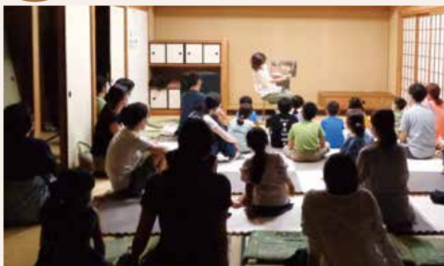
▲「夜ばなしの会」の様子