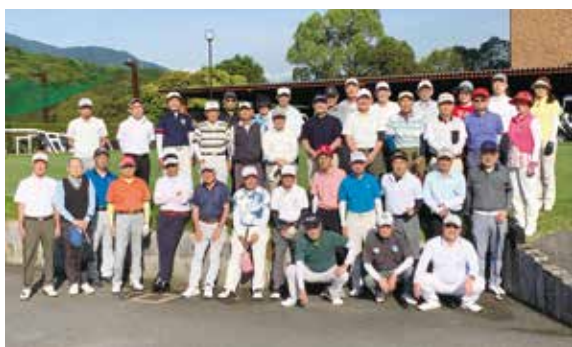
▲第300回記念大会での集合写真

6月7日、紅葉ヶ丘地区のゴルフ愛好会「紅葉会」による第300回記念大会が福岡市内のゴルフクラブで開催され、39人が参加しました。同会は地域の親睦を図ろうと昭和48年に発足し、今年で50年を迎えました。