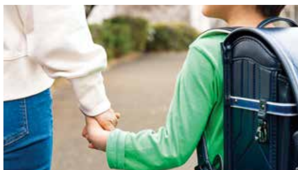
▲子どもの健やかな成長を願う親のイメージ

ひ ひとり親家庭が経済的に安定した生活を送り、子どもの健やかな成長を実現するための養育費は、重要な生活基盤の一つです。