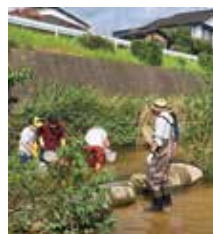
▲令和4年度開催の様子