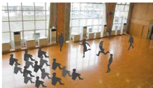
▲空調を設置した多目的ホールを活用しているイメージ

子 どもの豊かな人間性や生きる力を育むため、市は学校・家庭・地域の三者が一体となって子どもを共に育てる「コミュニティ・スクール」に取り組んでいます。