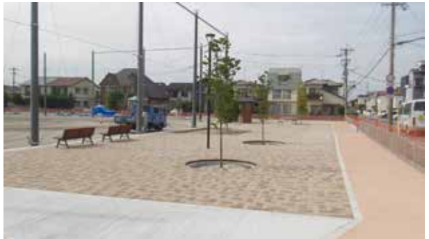
▲(仮称)春日西多目的広場公園