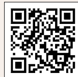
▲市電子図書館 ウェブサイト

IDを持っていない人は、図書館カウンター や市民図書館ウェブサイトから申請ができます。