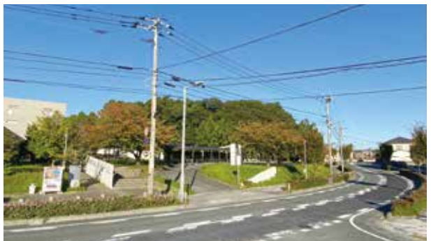
▲整備予定地(大谷ふれあい公園周辺)