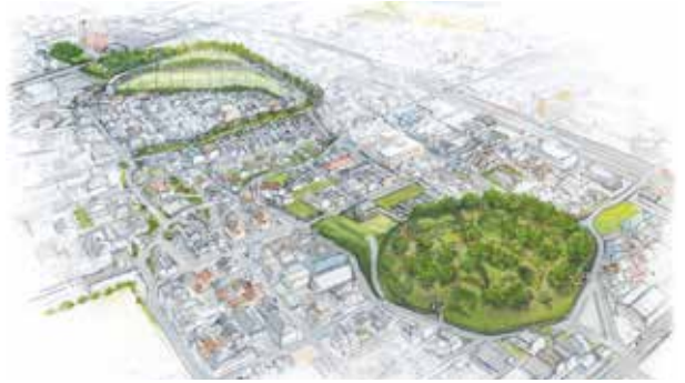
▲水城跡(大土居・天神山)整備のイメージ