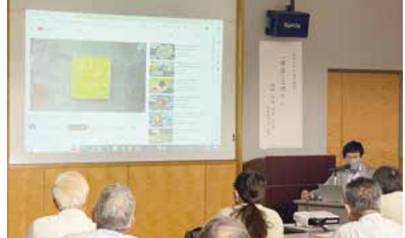
▲熱心に受講する参加者

6月17日、奴国の丘歴史資料館で弥生時代の青銅器生産を学ぶ第1回歴史講座が開催されました。