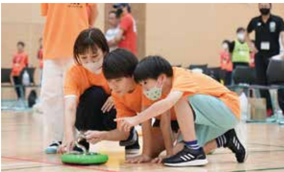
▲次の一投を決める作戦会議をする参加者

7月9日、総合スポーツセンターでカローリング大会が開催され、大人から子どもまで40チーム216人が参加しました。