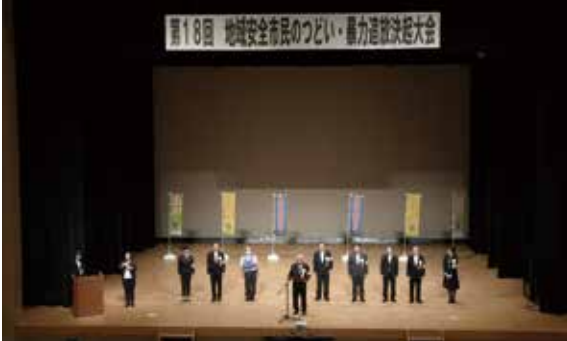
▲暴力追放宣言の様子

6月25日、ふれあい文化センターで、第18回地域安全市民のつどい・暴力追放決起大会が行われ、関係者など約300人が参加しました。