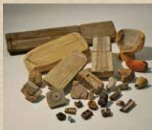
青銅器・ガラス玉生産関連遺物