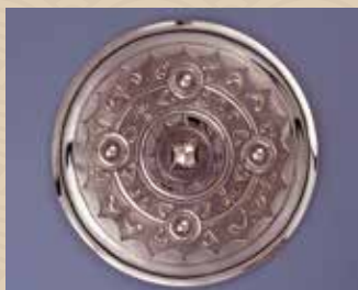
▲王墓出土鏡の復元品(草葉文鏡)