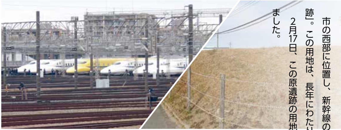
▲原遺跡からの眺望

2月17日、この原遺跡の用地を市民共有の財産として、市に寄附することで合意し、目録贈呈式が行われました。