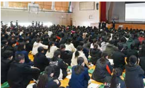
▲たくさんの生徒や市職員の前で発表