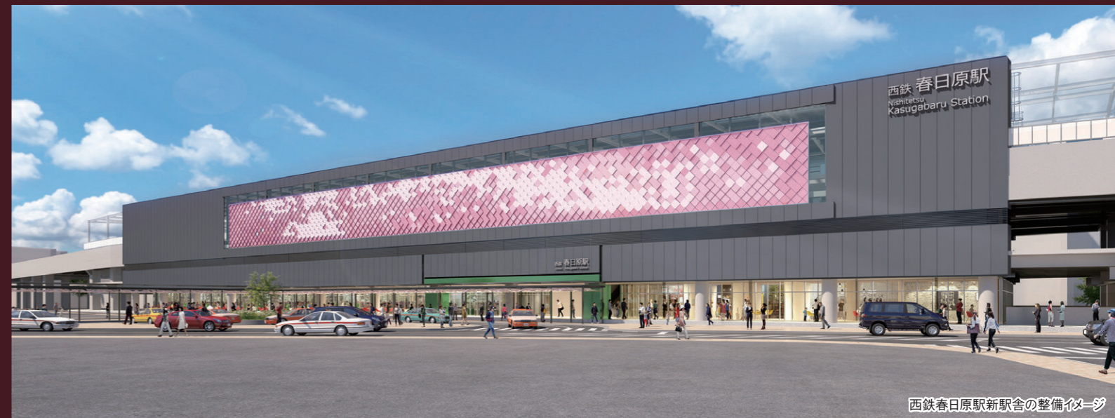
西鉄春日原駅新駅舎の整備イメージ

本年8月、待ちに待った西鉄天神大牟田線の高架切り替えが実現しました。新しい西鉄春日原駅も日々工事が進んでいます。駅周辺の整備も着々と進み、まもなく新しくなった「春日市の都心」が、その姿を現します。市制50周年の今年から、「新しい50年の都市づくり」が始まっています。