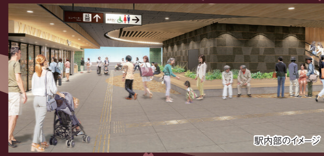
駅内部のイメージ