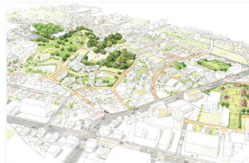
奴国の丘歴史公園周辺の整備イメージ