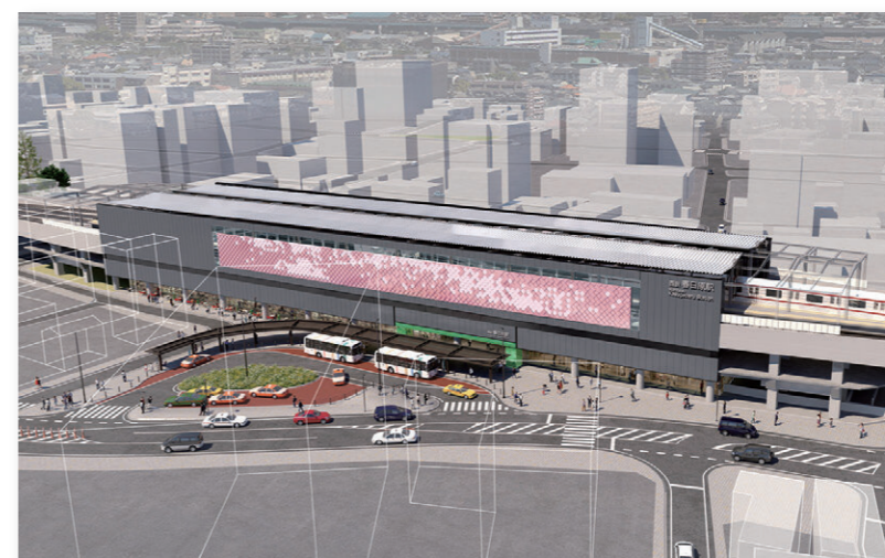
西鉄春日原駅新駅と駅前広場の整備イメージ