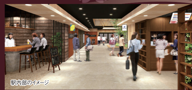
駅内部のイメージ