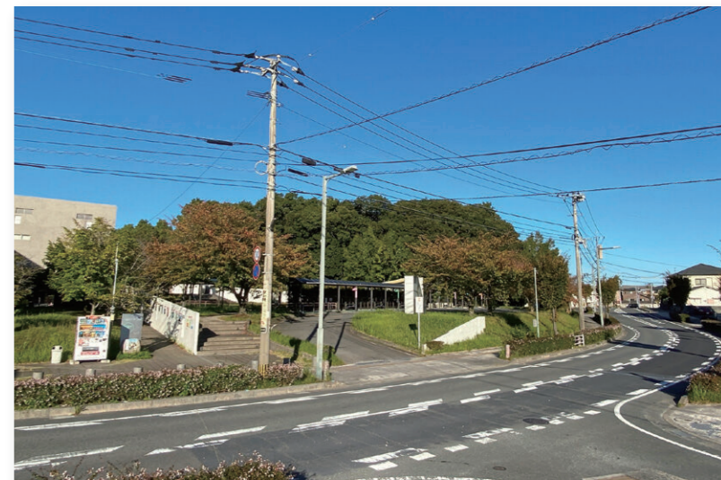
新たな地域共生社会の拠点施設の整備予定地(コミュニティバスセンター付近)