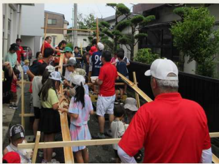
▲ 子ども集まれ（七夕祭り）