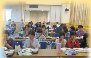
▲ 浄運寺の子ども食堂（元気ワクワク料理クラブ）

春日西中学校区では、地域の方が中心となって、月に1回、浄運寺で開催されています。子どもから大人までみんなで一緒に食事をする中で、子どもたちに「食べることは生きること」というメッセージを伝えています。老若男女みんなの拠り所（居場所）となっています。