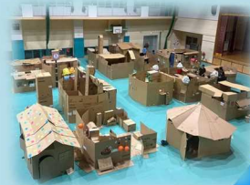
▲ おやじの会による体験型イベントの企画運営 （左：春日西小 はっちーボランティア隊） （右：白水小 おやじの会）