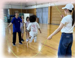
▲ あそびの城（なわとび）