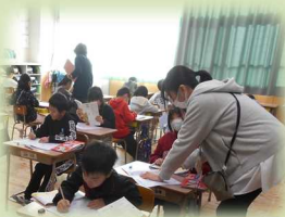
▲ 保護者による丸付けボランティア（白水小）

得意なことを生かしながら、子どもと関わることを単純に楽しめたり、授業参観では見られない子どもの様子に触れたりすることができます。