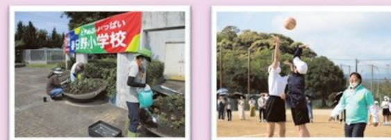
▲写真左：花のお世話ボランティア（春日野小） 写真右：の中応援団新入生歓迎ドッジボール大会（春日野中）の様子

得意なことを生かしながら、楽しく子どもと触れ合うことができ、また、授業参観では見られない子どもの様子に触れることができます。