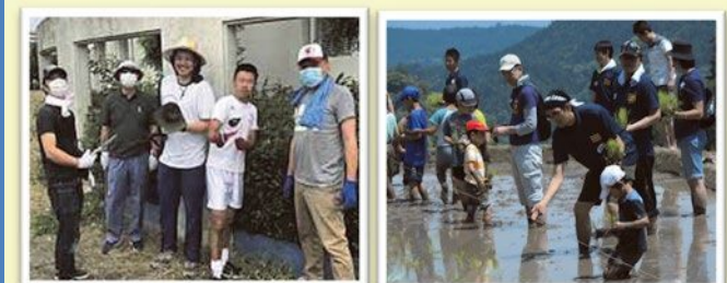
▲写真左：春日野小親児の会 校内草刈り 写真右：春日原小おやじの会 田植えの様子

おやじの会は、保護者や地域の方による任意団体です（母親も参加OK）。自分たちも楽しむことをモットーに、子どもの健全育成を支え、数多くの教育・体験活動や、学校・地域行事を支援しています。