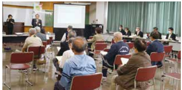
▲令和3年度の全体トーク