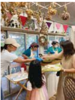
▲さまざまな世代と一緒に食事を楽しむ子ども食堂