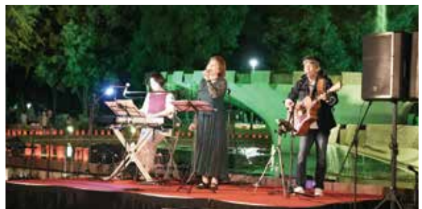
▲会場を盛り上げた市民ライブ

来場者からは「たくさんの方が集まり、楽しそうにしている姿を見ることができてよかった」、「普段とは異なる春日公園の雰囲気に感動した」といった感想が聞かれました。