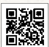
▲Eメール作成フォーム