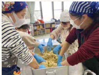
▲令和3年度のみそ作り教室の様子