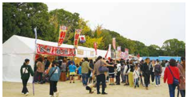
▲多くの人でにぎわう商工展