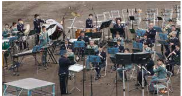
▲ゲスト演奏で盛り上げた陸上・航空自衛隊の音楽隊の皆さん