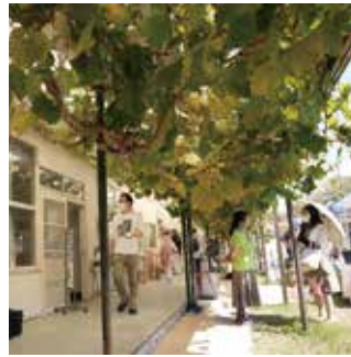
▲温かみのある建物に市民が集う