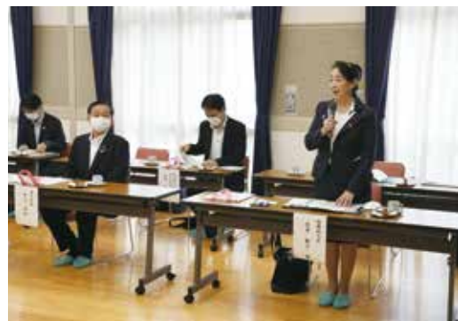
▲視察を終えての感想を述べる尾身副大臣(右)

問い合わせ先 地域づくり課協働推進・文化振興担当 ☎(584)1111(代) 📠(584)1153