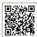
▲国税庁の取組紹介