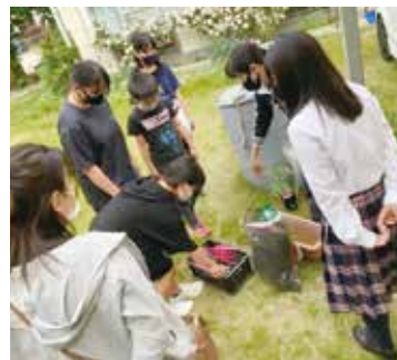
▲フリースクールの活動(花植え)

問い合わせ先 地域づくり課 協働推進・文化振興担当 TEL (0584)11111(代) F (0584)11153