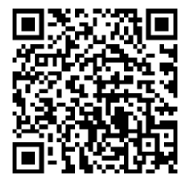
朝ごはんのススメ 動画「前編」 二次元コード

春日市のホームページにて昨年度小学校で公開した朝ごはんについての動画を掲載しています。右の二次元コードを読み取ると動画を見ることができます。ぜひご覧ください。