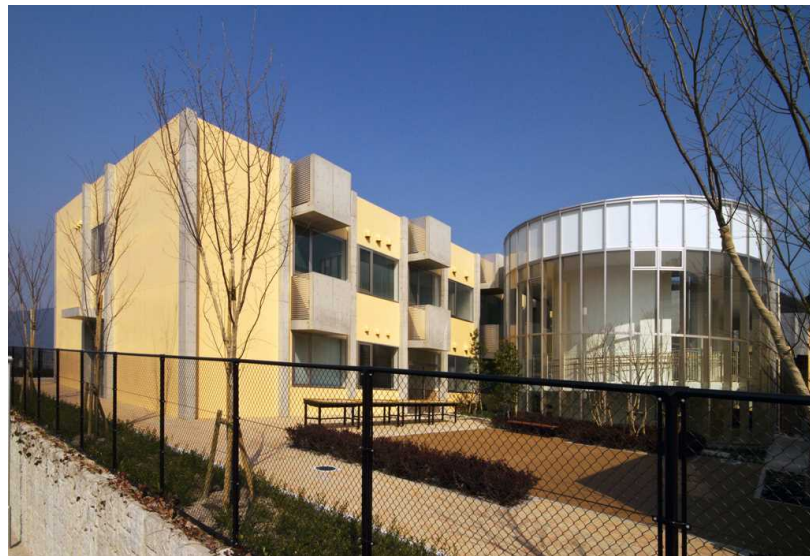
福岡県立太宰府特別支援学校（知的障がい・肢体不自由）