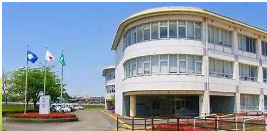
福岡県立福岡視覚特別支援学校 （筑紫野市）