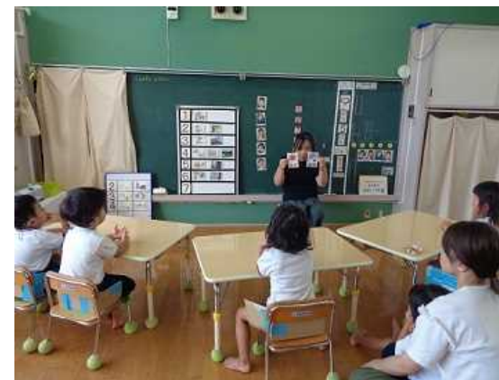
福岡県立福岡聴覚特別支援学校 （早良区）