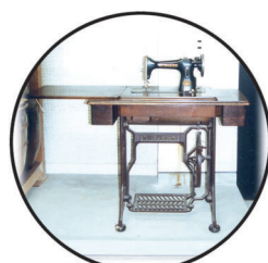
足踏みミシン ペダルをふんでつかうミシンです。両手をつかえるようになり、つかいやすくなりました。