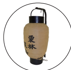
提灯 (ちようちん) 足元をてらすために持ち歩いたり、標識としてそなえつけたりするものです。