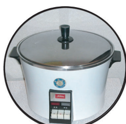
炊飯器 (すいはんき) かまど・羽釜・おひつの仕事が、これ一つできるようになりました。