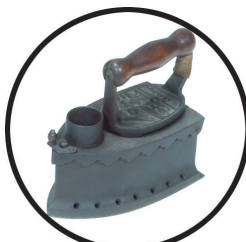
炭火アイロン かたちは今のアイロンに似ていますが、これにも熱した炭を使っていました。