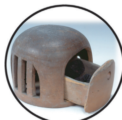
行火 (あんか) 上にふとんをかけて、ねるときに、手足をあたためていました。