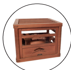
樽ごたつ (やぐらごたつ) もちはこべる暖房器具です。布団などにいれて直接手足にあてて暖をとります。