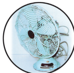
扇風機 (せんぶうき) 扇風機は、むかしとても高かったため、おおくのひとはうちわをつけていました。

そうじやせんたくは、今でもたいへんな仕事です。しかし昔は、洗濯機も掃除機もありません。そのため、お母さんは毎日いそがしく働いていました。 また、子どもたちもお母さんのお手伝いで掃除などをしていました。