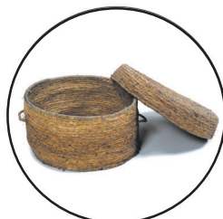
おひつふご (めしふご) 冬にご飯が冷めないように、わらでつくった飯びつを中に入れて使いました。