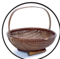
飯籠 (めしかご) 夏はかごのなかにご飯を入れて涼しい所におき、腐りにくくしていました。