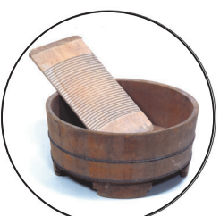
せんたく板 せんたく板のデコボコしたところに、服をこすりつけながらあらいました。