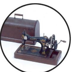
手まわしミシン ハンドルを手でまわしてつかうミシンです。当時はとても高価でした。