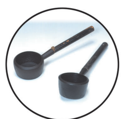
火熨斗 (ひのし) なかにいれた炭の熱で、服のしわをのぼしました。むかしのアイロンのかたちです。