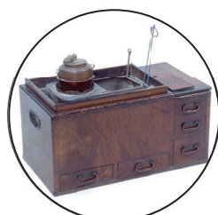
火鉢 (ひばち) 手をあたためたり、お湯をわかしたりするとうぐで、冬にかかせないものでした。

電気がなかった時代は、エアコンなどありませんでした。そのため夏は暑く、冬はとても寒いものでした。 涼をとるためのうちわや、暖をとるための火鉢などがおうちにはありました。