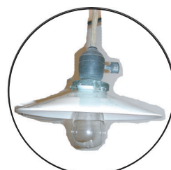
電灯 (でんとう) 電灯の登場によって他のあかりの道具は、つかわれなくなっていきました。

電気がなかった時代は、エアコンなどありませんでした。そのため夏は暑く、冬はとても寒いものでした。 涼をとるためのうちわや、暖をとるための火鉢などがおうちにはありました。