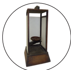
行灯 (あんどん) 風がふいても、火がきえないように、周りを和紙で囲んであります。