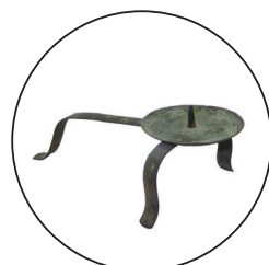
手燭 (てしよく) 手で持ち歩けるように柄を付けたろうそくをたてるための台です。