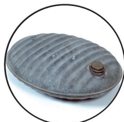
湯たんぼ (ゆたんぼ) なかにお湯をいれてつかい、朝ぬるくなったお湯を顔あらい用としてつかいました。