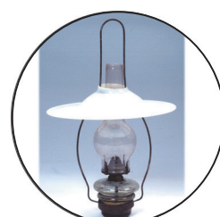
石油ランプ ロウソクよりも、ずっとあかるいのですが、汚れやすかったです。