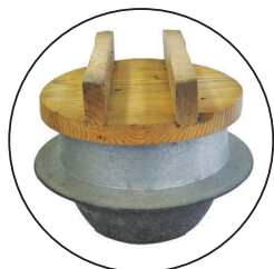
羽釜 (はがま) ご飯をたいたり、お湯をわかしたりするときに使われていました。