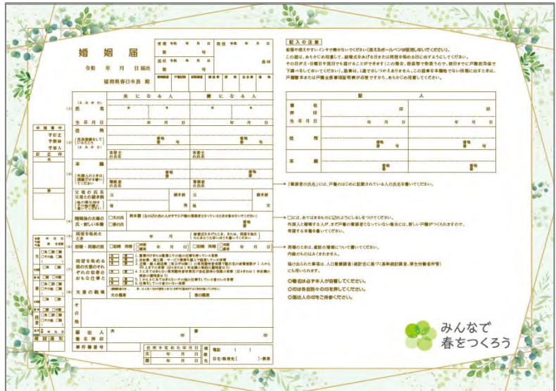
▲新様式（現在作成中）