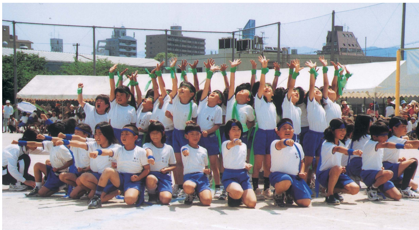
力を合わせて頑張りました(日の出小学校運動会)

お問い合わせ：春日市議会事務局 ☎092-584-1113 http://www.city.kasuga.fukuoka.jp/gikai/index.html