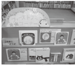
ファーストブック事業