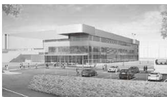
建設が始まる(仮称)総合スポーツセンター

市債(市の借金)は対前年度比3.6%増の22億円です。3年ぶりの増加となっている。これは市営若草住宅や(仮称)総合スポーツセンターの本格着工によるものである。