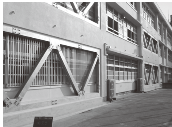
小・中学校耐震化事業