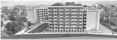
市営若草住宅鳥瞰図