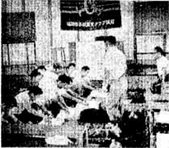
館長の人工呼吸の講習

いよいよ水の季節と小学校の夏休身体表を達した。今年も本町から水難救助講習会を一名出してはならない。各機関団体で水難救助講習会が開催され、各会場とも至るの盛況を呈し、水難救助講習会は、熱心に行なわれた。