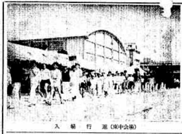
入場行進(東中会場)

このことによって、これまで広範囲にわたった会場も限定され、選手も限定される。また、運動会をとり入れたため、今迄に無い緊張感がつくり出され、町民体育大会も五回を迎えて新しい転機を遂げたといえる。