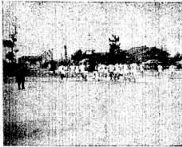
春日中学校を一齐にスタート