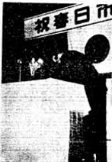
柴田市長から工事協力者に感謝状(上) 落成式会場の市民体育館(下)