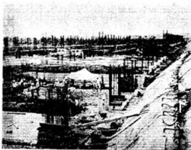
平和台野球場の8倍の広さもある汚水処理場（建設中）

市内で1日に出でくるゴミの量は生ゴミが34トン、燃えないゴミ12トン、不燃ゴミは大野城市との共有地で埋立てに使っていますが、生ゴミは17両のトラックで毎日、大野城市牛頸の筑紫地区焼却施設組合のじん焼却場に運んでいます。