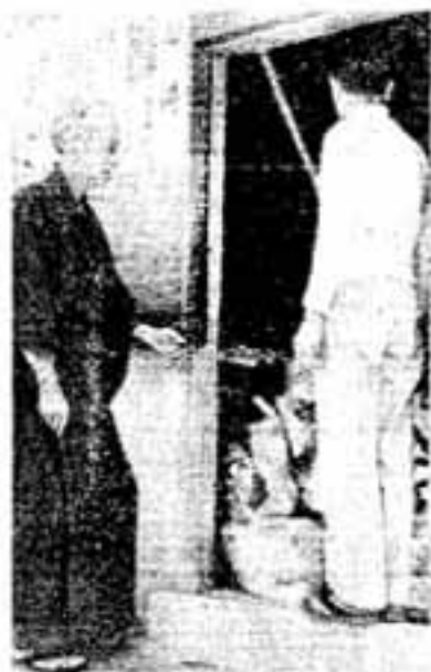
大和町第1町内の不燃物倉庫

私たちの住んでいる「春日」を美しくしよう。私たちや子どもたちが、よそで自慢できるキレイな町にしよう。との気持ちさえあれば、どんなゴミが出てても簡単に片付け事柄なのです。これからは、ゴミが特にふえ、不潔、不衛生になりやすいシーズンですので、市内の不燃物置き場を見て廻りました。