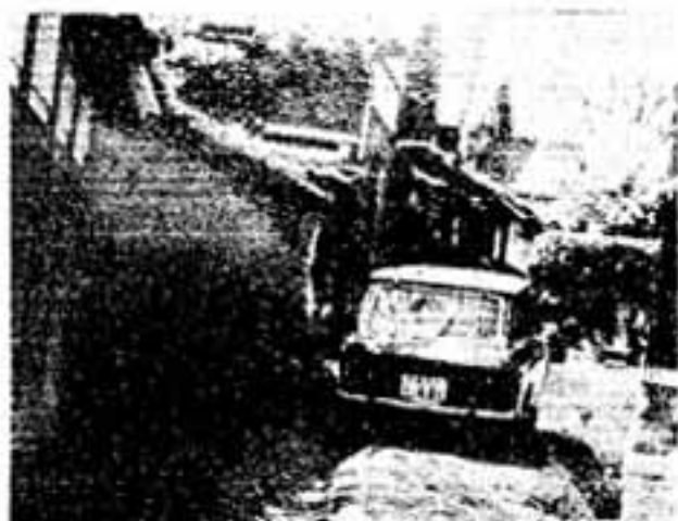
まだ整備されない道路

こんな状態を、できるだけ早く手をつけて、解決していききたいものです。これが「区画整理」であり「住みよいまちづくり」に通じます。みんなが将来のことをじっくり分考えて「まちづくり」に積極的に参加しましょう。