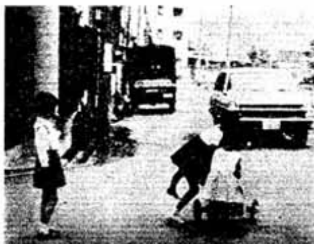
子どもたちの遊び場がないと

このため、無計画な宅地化（いわゆるスプロール現象）が進んでいる地域や、生活環境がすでに悪化している地域では、道路、公園、下水道などの公共施設を整え、生活環境を改善することが必要になります。