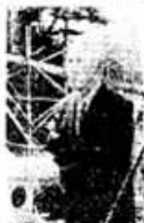
武末英輔さん王申を