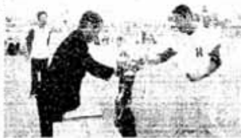
柴田市長から優勝杯を授与