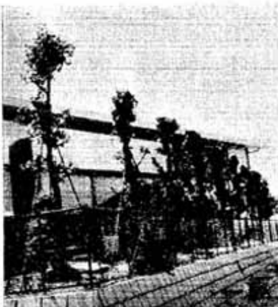
買文は昔ほど高くないが 元気なポプラ(須玖小で)

○みなさんの前から、私たちが姿を消したのは今年の3月でした。市が水害防止のため、グリーン・ベルト横の水路幅の拡張工事を始めたので、工事の妨げになつてはと、全部掘り起されて他の場所に移植されました。