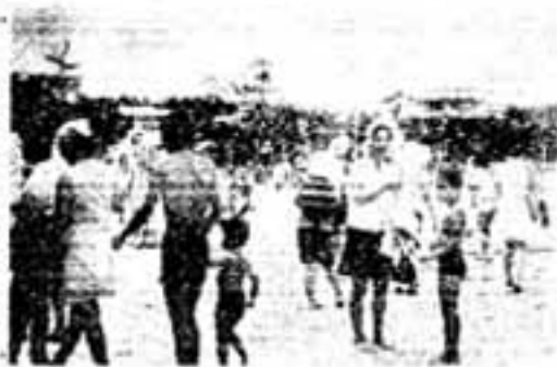
去年の市民プールのにぎわい