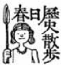
春日歴史散歩 岡本

大阪城の石は、舟に乗せて紀州から運んだ、とか。石を舟にぶら下げ、舟中に沈めて運んだ、とか。石がはねのけた水の目だけ鮮くなりますが、舟の運行にはきまたげになります。こんな