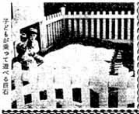
子どもが楽しんで遊べる巨石