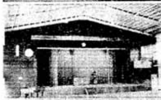
屋内体育館の全貌(上)と立派なステージ