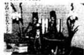
(手芸展会場と残り布など活かしたヒナ人形)

立つ傾向もありましたが、残り布や使い残しの毛糸を活かした質屋愛護型の作品もたくさん見られて時評を映し出していました。