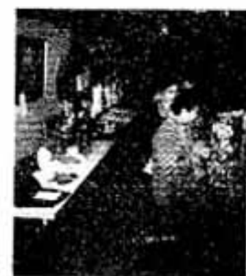
(手芸展会場と残り布など活かしたヒナ人形)

市内では、春さき恒例の催しものとして、毎年婦人の関心をたかめています。手芸展と木彫展が、こゝしも2月14日から4日、中央公民館で開催されました。