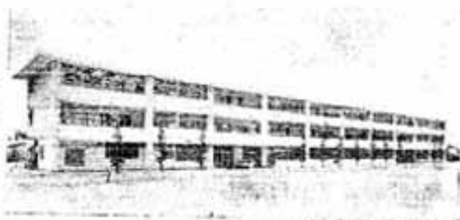
昨年開校の須玖小学校校舎