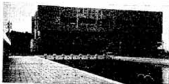
市民プールから体育館を望む