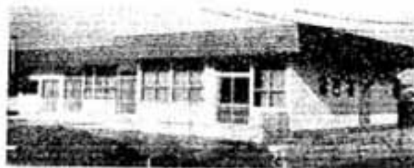
市ご自慢の身障児 通園施設「螢光園」