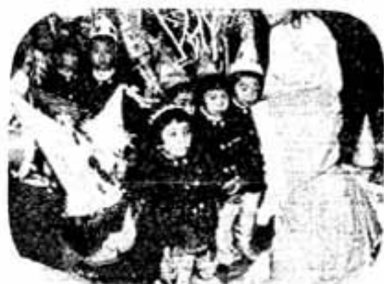
● 事の23日、公民館の館で行われ、引越きおとしよりとゼンザイをいただきました

● サンタのおじいさん(白水福祉事業所長)のお話をきく子どもたち。おみやげのプレゼントのほうがり持ちどおしい(岡本保育園で)