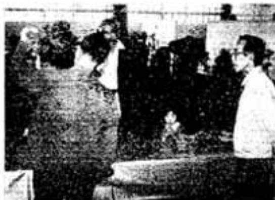
10万円抽の鉢も並んだ盆栽会場