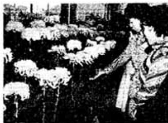
菊花会場は花の香りが一ぱい