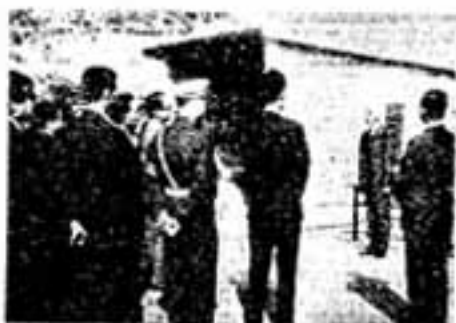
●開通式 ●渡り初めする南小の子どもたち

春日、諏訪方面から春日南小学校に通学している児童たち200人が、とくに待ちわびていた県道5号線の「春日地下歩道」が、4ヵ月おりにでき上り、去る10月23日午前10時から地下歩道南側入口で開通式が行われた。