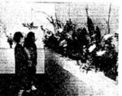
写真せつめい(上)から手袋・曹通・菊花・生花の各展示会場