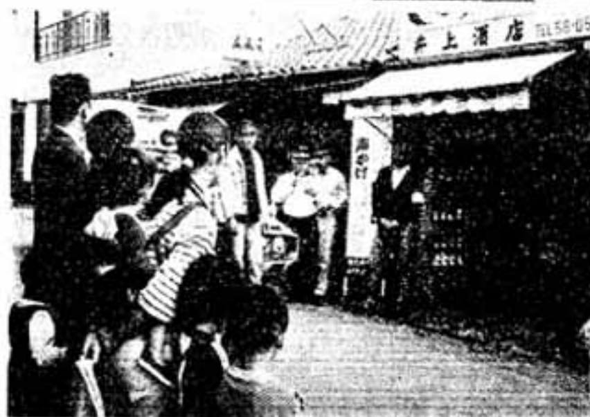
……防犯広報する推進委員たち……

昭和50年 国勢調査速報 春日市の人口(概数) 総人口 55、160人 男 27、697人 女 27、463人 世帯数 17、536世帯