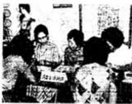
市消費生活相談所

市は、夏物の商戦で賑わうユニードとサニーの両スーパー店内に7月29日「春日市消費生活相談所」を特設して、買い物ものに来た市民みなさんの苦情相談を受けました。 市の消費生活相談員10人が2店に分かれ、午前10時から午後4時までガン張ってお客さんをお待ちしましたが、結局、障かき、水道の蛇口、生鮮食品などの苦情が4件だけ。「消費者が利口になり、またメーカーや店の自覚で欠陥商品が少なくなったのでしよう。」相談員のみなさんが口を揃えて