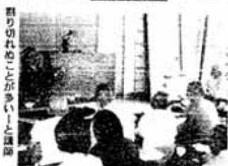
割り切れぬことが多いと講師