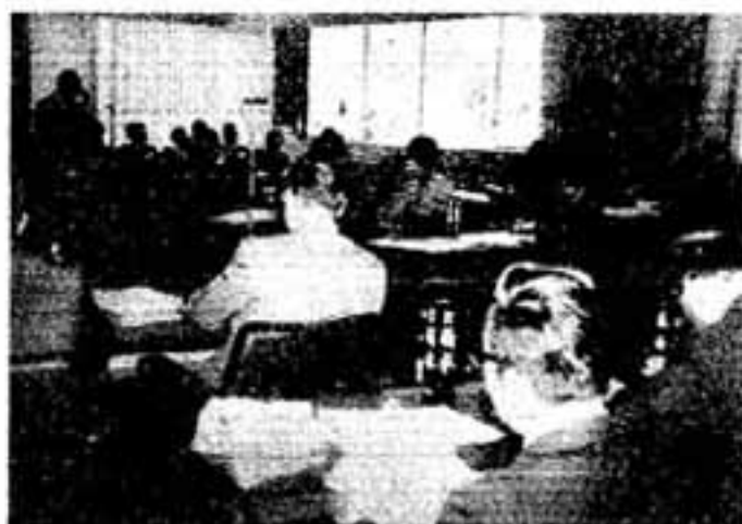
予算案を説明する亀谷市長