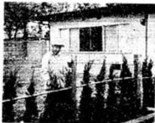
新築のマイホームも生けがき (春日原東町で)