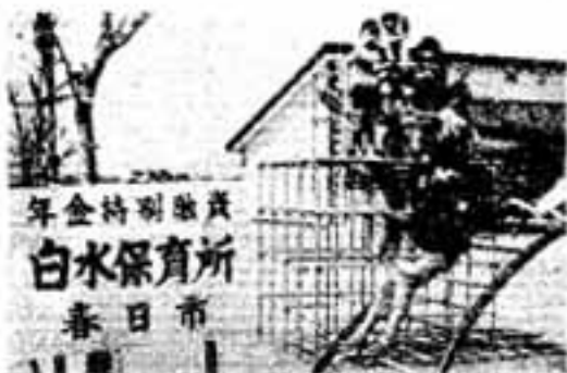
本市特別 白水保育所 春日

路上駐車厳しく取り締まる 警告500、検挙20台 交通事故防止と安全対策の一つ として春日市交通安全協会、筑紫 野警察署、消防団が協力して毎月 1回、夜間路上駐車指導取締を しております。そして駐車違反の 車はつぎとぎ検挙されています。 なお春の交通安全運動期間に20 台が検挙されました。また指導警 告を受けた台数は500台以上に なり、特に千歳町、光町、宝町 春日原の各地区には市内の車の6 割が駐車しております。これから も、びしびし指導取締を強化して いきますので、車は必ず申請され た保管場所に保管してください。 (坂井 謙)