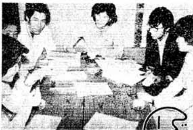
区誌第7号の編集会議(紅葉ヶ丘公民館で)

新興住宅地の紅葉ヶ丘地区で区誌「もみじ」が発行されています。ガリ版16ペーロ前後、年4回、3ヵ月に1回の発行ですが、この「もみじ」編集人を中心とした青年グループの活動が、同区発展の推進力の1つにもなっています。