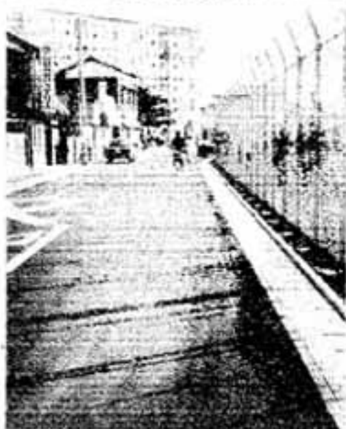
自衛隊前の大和町市道