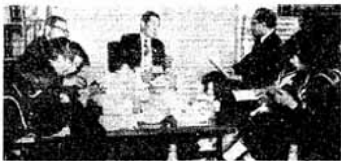
なごやかに 市長を囲んで

市長・市議会議員選挙の投票所 入場券（ハガキ）は、投票には、 じゅうぶん間に合うよう、市選挙