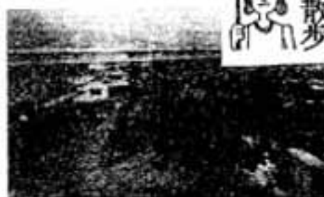
塚の上(手前)から300米先を新幹線が走る

向って電灯を照らしますと、下の石より上の石が、わずかですが前方に突き出て、次の石はさらに少し前に進んでいます。このような技法を使って石室は構築されています。ここをじっくり観察していただきたいと思ひます。