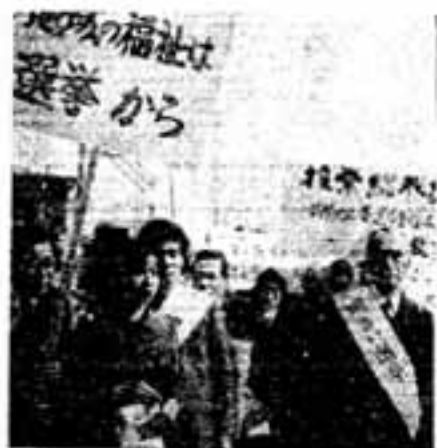
「明るい選挙」の呼びかけ＝春日原駅前