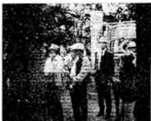
住吉神社(須賀)見学の一行