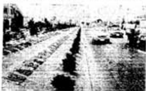
防火道路の中央にもグリーンベルトを設置

万7千市民が1本ずつ植樹する「6万本植樹」の構想をねっています。 春日市をより住みよくするため、市民みなさんのご協力とご理解をお願いします。