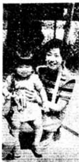
須玖公民館 で ひろく