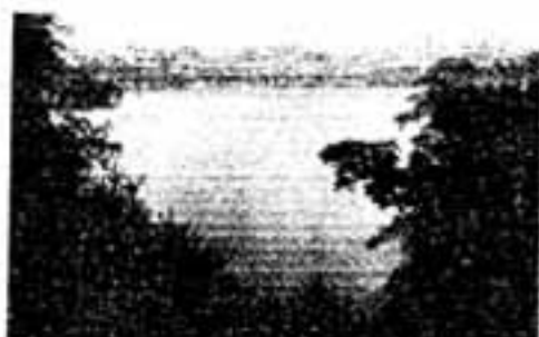
白水池周辺は緑地保全林地区に指定

では、市の都市計画事業で、市が、いま懸命に取り組んでいるのは、都市計画道路事業・公共下水道、県の流域下水道事業・都市計画公園事業・区画整理事業などで、いずれも年次計画をたてて各事業に現在、着手しています。 これらの都市計画関係各事業は市の各担当部署で事業計画案ができた頃、市の都市計画審議会、つづいて県の都市計画審議会にはかって計画が決定され、ここではじめて事業実施ということになります。 このように、都市計画事業が、きわめて慎重、かつ綿密に実施されるのは、都市計画と事業実施がきざきまで市民みなさんの生活や日常の活動に重大な影響をもっており、都市計画事業を実施するには膨大な費用がかかるからです。