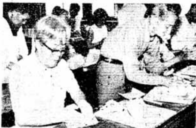
土こねに懸命の陶芸科学級生

春日市老人大学が6月から開講されました。学級生は市内の老人クラブ会員で、昨年度まで開いてきた高齢者学級の教課は、教養学科とし、新しく陶芸・木工・園芸の専門学科3コースを設けて「老人大学」に改組したものです。