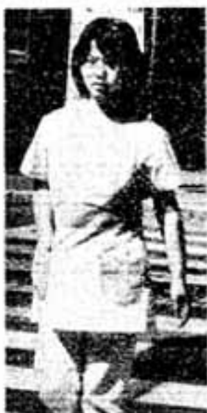
光町東通交差点で

です。詳しいことは市役所内、福祉事務所(番50111131内227)へお問い合わせください。