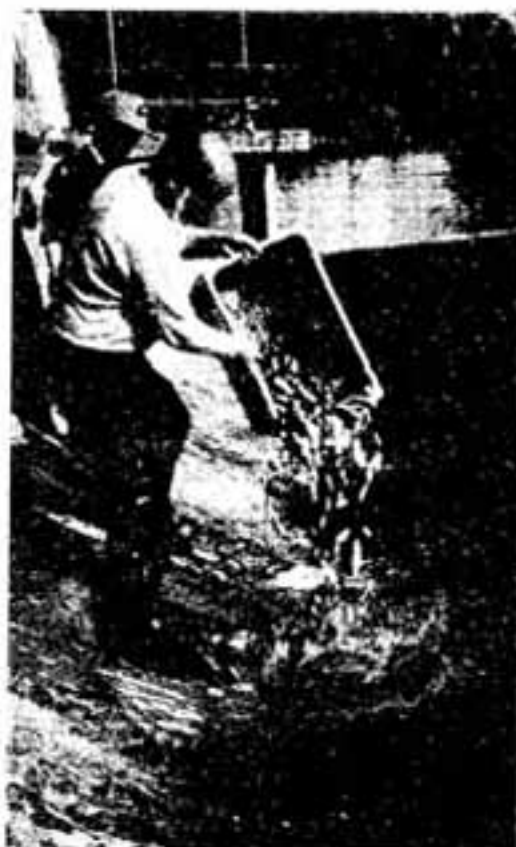
早く大きくなれよ！トラックで運んで放流

白水池にコイ4000匹が放流されました。こんど放流されたのは、コイの稚魚10万匹と体長40センチのもの約5000匹で、市が3月末、3回にかけて放流しました。コイの群れは運搬途中の疲れを取り戻したように、元気に池の中に姿を消していきました。