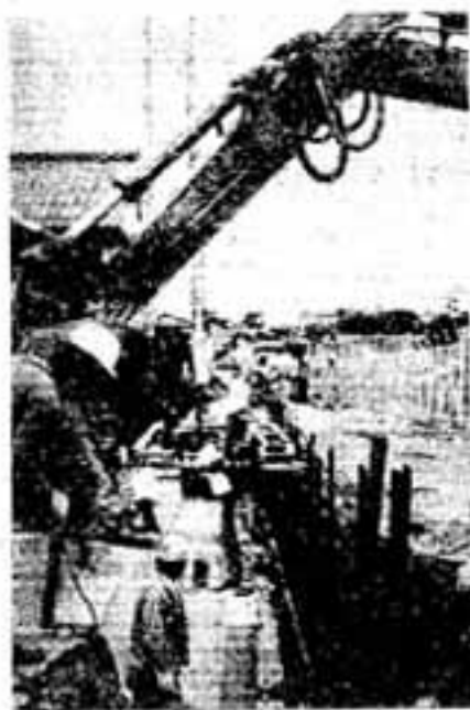
水害防止工事すすむ

降雨時の漏水、溢水をなくし、市内から水禍を一掃するため、市が諸河川の改修工事および池田水路500メートルの拡幅工事に続き進めていきました。路上自衛隊前・大和町の排水路200メートルの新設工事がこのほど終わりました。市は、これらの水路とつながる路上自衛隊前と池田水路1352メートルの工事にも着手しました。