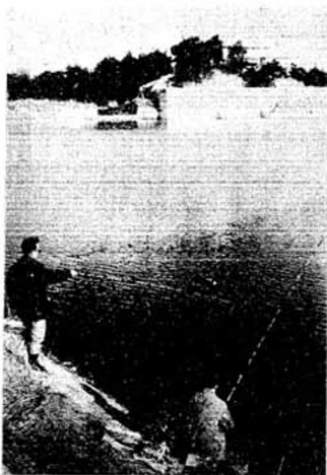
釣り糸を振れる市民の姿もふえました。